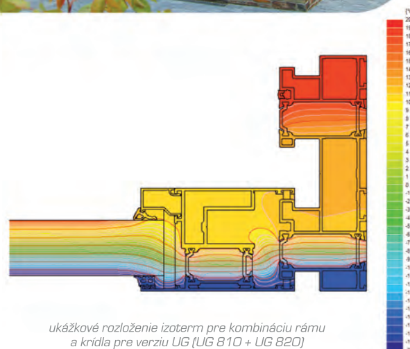
ukázkové rozloženie izoterm pre kombináciu rámu a krídla pre verziu UG (UG 810 + UG 820)